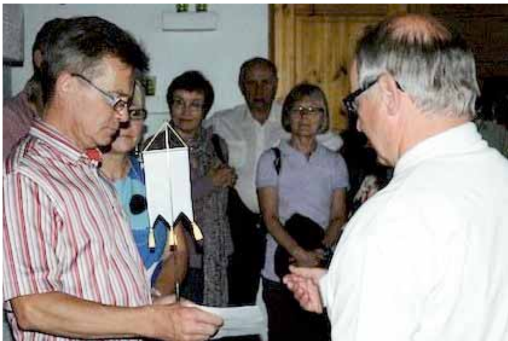
Luovutimme sukumme viirin Mammolan talon isäntävälle.