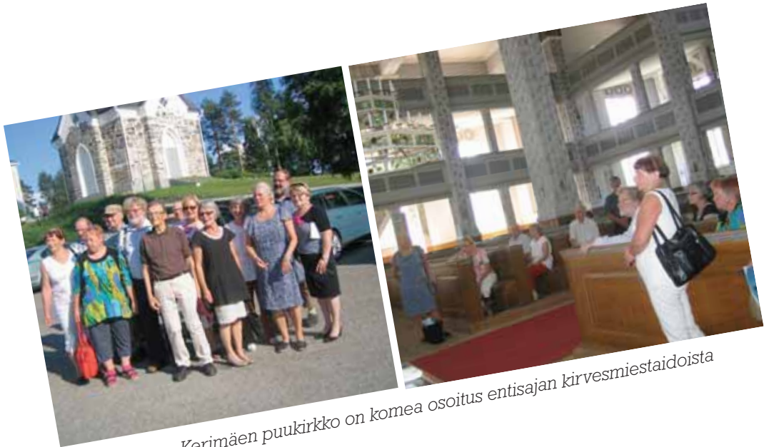
Kerimäen puukirkko on komea osoitus entisajan kirvesmiestaidoista